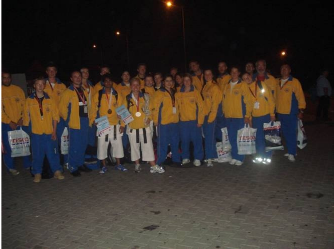
Gruppenbild VM 2007