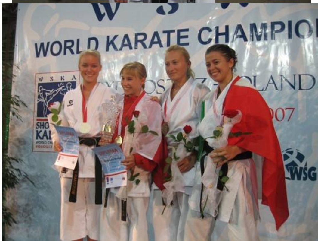
1a: Polen; 2a: SVERIGE; 3a: Serbien Montenegro; 4a Italien.