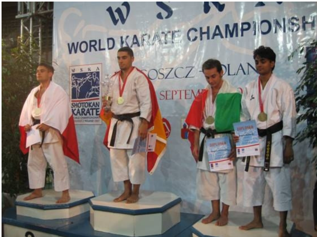
1a Spanien: 2a Polen: 3a Italien: 4a SVERIGE